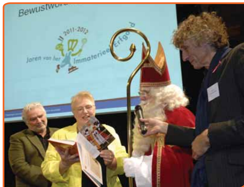
Sint Nicolaas zelf nam het boek Dit zijn wij in ontvangst.

Voor onze enquête hebben we gekozen voor een open vorm. We hebben eenvoudigweg gevraagd: 'Noemt u ons de tien belangrijkste tradities in uw leven'. We hebben niet gevraagd: 'Noemt u ons eens tien typisch Nederlandse tradities'. Als we dat gevraagd had-