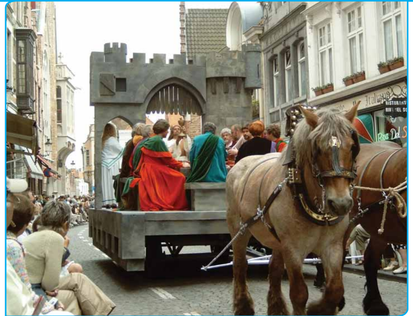
Heilige Bloedprocessie in Brugge

Van den Broucke concludeert dat de strategie om het immaterieel erfgoed beter zichtbaar te maken behoorlijk is gelukt. Toch blijven er nog wat vraagpunten over. Men is begonnen in de praktijk, het is nu zaak om het immaterieel erfgoed een goede afgewogen