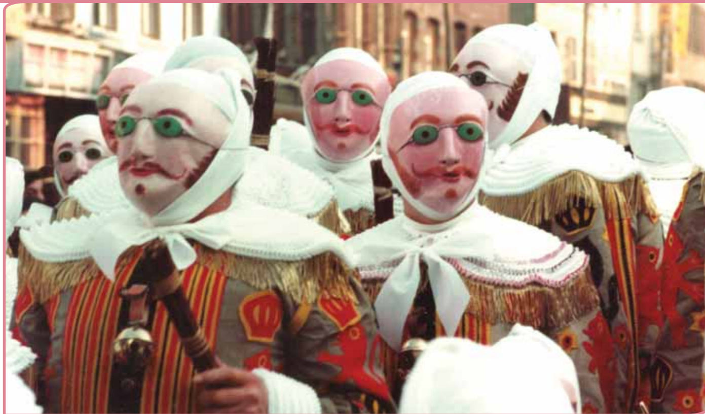
Carnaval in Binche

nu. Deze campagne resulteerde in de breed opgezette bundel Alledaags is niet gewoon. Reflecties over volkscultuur en samenleven . In 2004 werd het volkscultuurbeleid via het Erfgoeddecreet geïntegreerd in het bredere erfgoedbeleid en ging het Vlaams Centrum voor Volkscultuur op in FARO, het Vlaamse steunpunt voor cultureel erfgoed. Dat wil echter niet zeggen dat het begrip volkscultuur werd vervangen door de term immaterieel erfgoed. Beide begrippen blijven in Vlaanderen gebruikt worden, waarbij immaterieel erfgoed (anders dan in Nederland) wordt gezien als de bredere term.