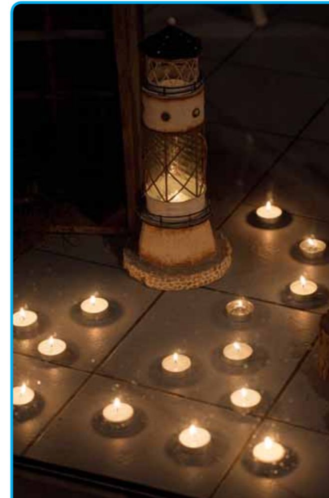
Sint Rochusverlichting in Aarschot