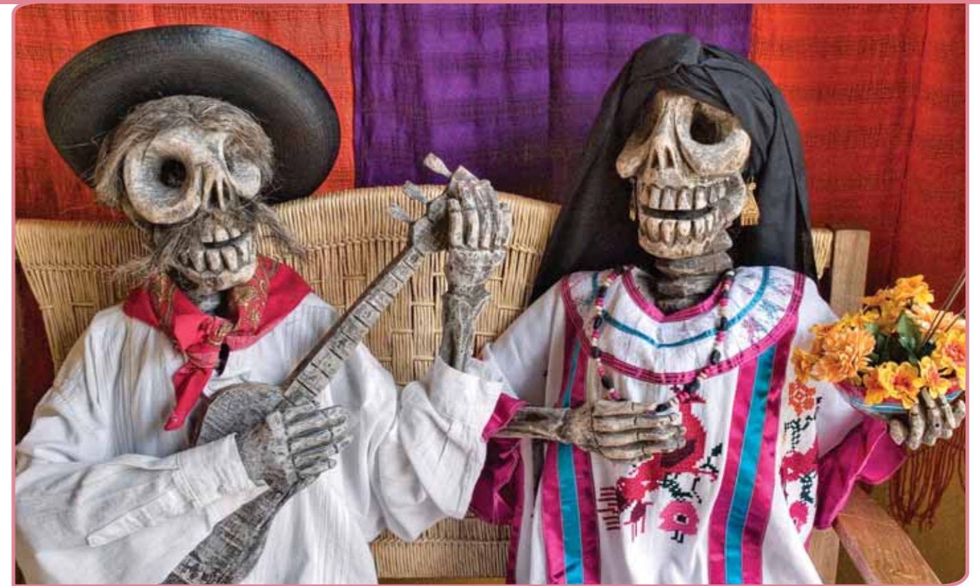
Dodendag in Mexico