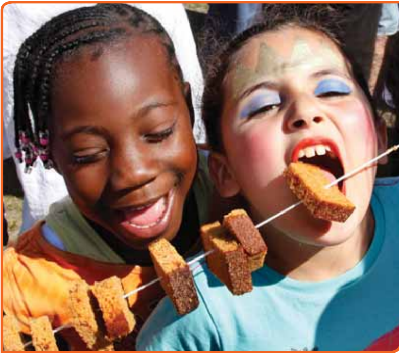
Koekhappen op Koninginnedag

in het leven van mensen. Bijvoorbeeld in levenslooprituelen rondom geboorte, huwelijk en dood. Maar ook in religieuze feesten en gebruiken. Nog weer andere tradities roepen dierbare herinneringen op aan de eigen jeugd, zo vielen zaken op als warme chocolademelk drinken (op 91), de eerste communie (98) en Mariabiscuit (94). Nog weer andere zaken worden verbonden met nationale identiteit, zoals bijvoorbeeld het feest van Koninginnedag (op 3),