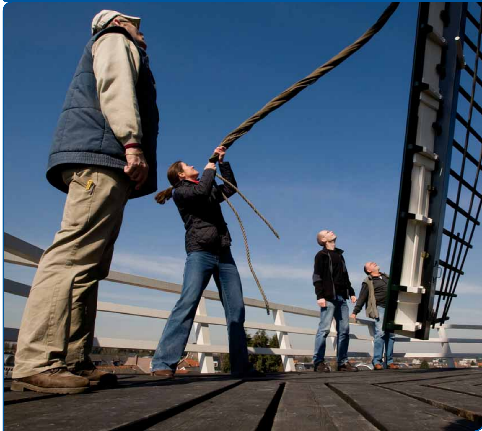
Het ambacht van molenaar