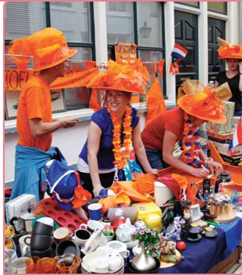
Koninginnedag in Utrecht

Ze maakte dit onderscheid duidelijk door te verwijzen naar het onderzoek van het Nederlands Centrum voor Volkscultuur naar wat Nederlanders belangrijke tradities vinden. Op deze lijst staan gebruiken met een geschiedenis, die ook op een immaterieel