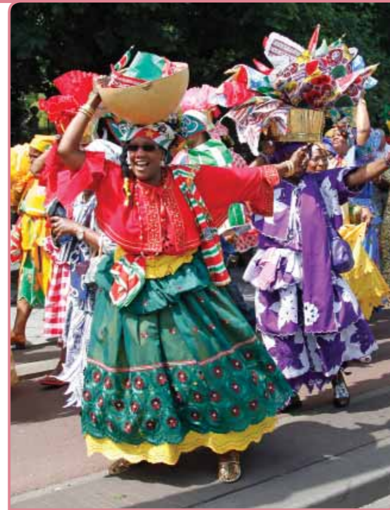
Keti Koti in Amsterdam