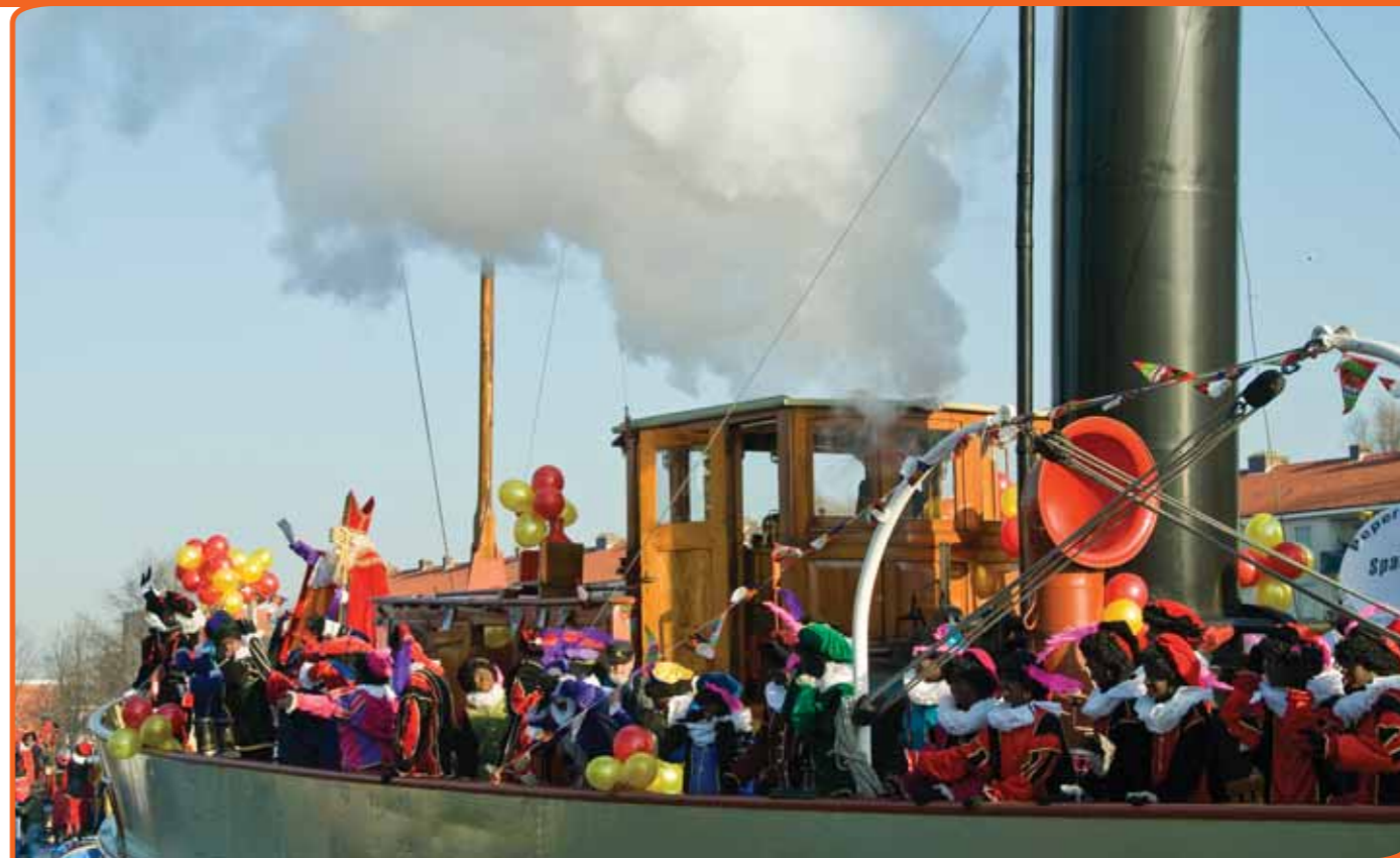
Sinterklaas is uitverkozen tot belangrijkste traditie in Nederland.

den, dan was de uitslag waarschijnlijk heel anders uitgevallen. We vroegen niet naar beelden en zelfbeelden. We vroegen op een heel persoonlijk niveau: 'Wat is voor u belangrijk?'. Zo is voor velen die in Nederland wonen Ketu Koti (op 58) een belangrijke traditie. Dat blijkt uit de uitkomsten van de enquête. Het is een belangrijk feest in Suriname en zal dus vooral door Surinaamse Nederlanders zijn ingevuld. Op een zelfde wijze zullen katholieke Nederlanders gezorgd hebben voor een hoge notering van de Mariaverering (op 61). De lijst van honderd belangrijke tradities is dus een gemiddelde. Het is niet zo dat voor iedere Nederlander al deze honderd tradities belangrijk zijn in deze volgorde. Voor de een is de gewoonte van een biertje drinken (25) belangrijk, terwijl de ander naar de kermis gaan (20) of moederdag vieren (16) als belangrijke, steeds weer terugkerende traditie heeft ingevuld. Zo kun je ook niet zeggen dat de passiespelen in Tegelen (op 84) een belangrijker traditie is dan de traditie van de Limburgse vlaai (85).