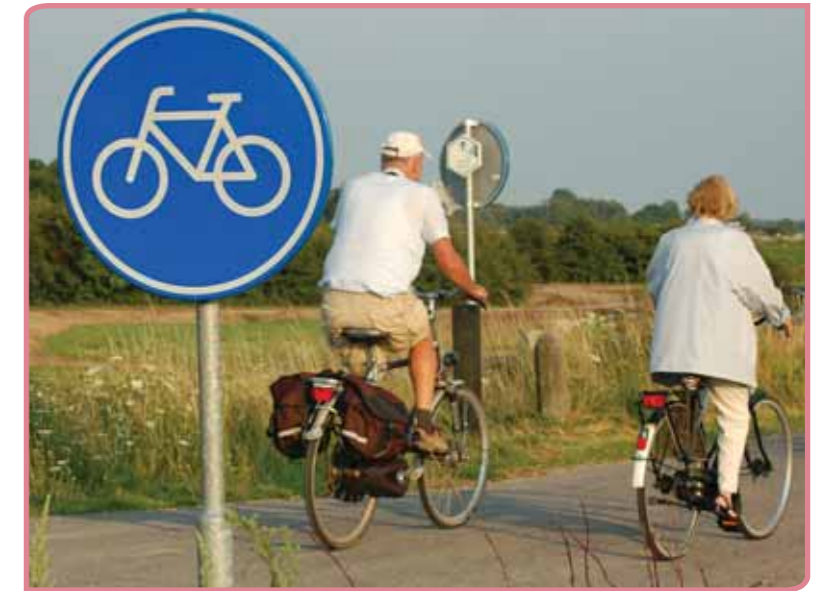
Fietscultuur in Nederland