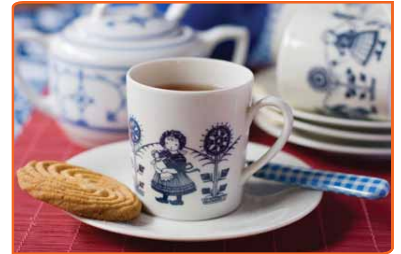
Een koekje bij de koffie of thee als symbool voor de Nederlandse zuinigheid

Dingen die je met plezier doet, daar denk je met genoeg aan terug. Minder leuke dingen, die toch ook verbonden kunnen zijn met tradities, verdringen we misschien het liefst. Bijvoorbeeld de traditie van het thuis opbaren na een overlijden (op 77), waarvan het belang voor mensen wel eens veel groter zou kunnen zijn dan deze lage plaats op de lijst doet vermoeden. Het geldt mogelijk ook voor het bijgeloof (96). Uit ander onderzoek blijkt dat veel mensen bijgelovig zijn, maar daar niet altijd voor uit willen komen.