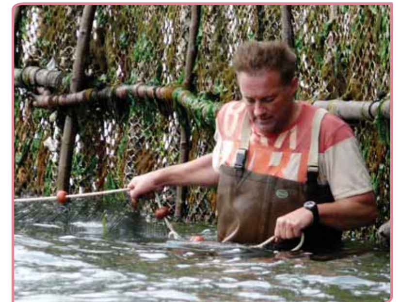
Ansjovis vissen in Bergen op Zoom