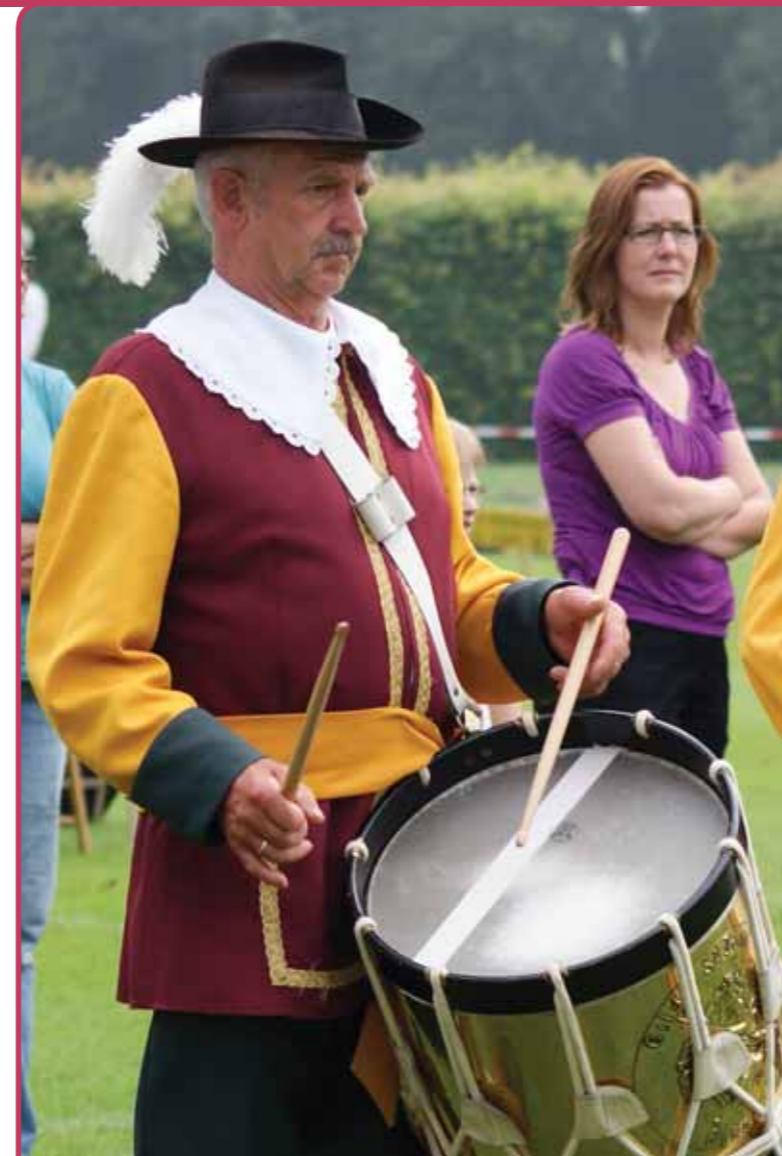
De OLS is grensoverschrijdend

Wat betreft het actieplan, dat deel moet uitmaken van elke voordracht voor de Vlaamse Inventaris, wees Ressen op enkele praktische knelpunten. Rondom vuurwapens bestaat in België tegenwoordig wetgeving, waaraan ook de schutters moeten voldoen. Het is een probleem waar ook de levende geschiedenis groepen mee te maken hebben, als zij bijvoorbeeld een veldslag willen