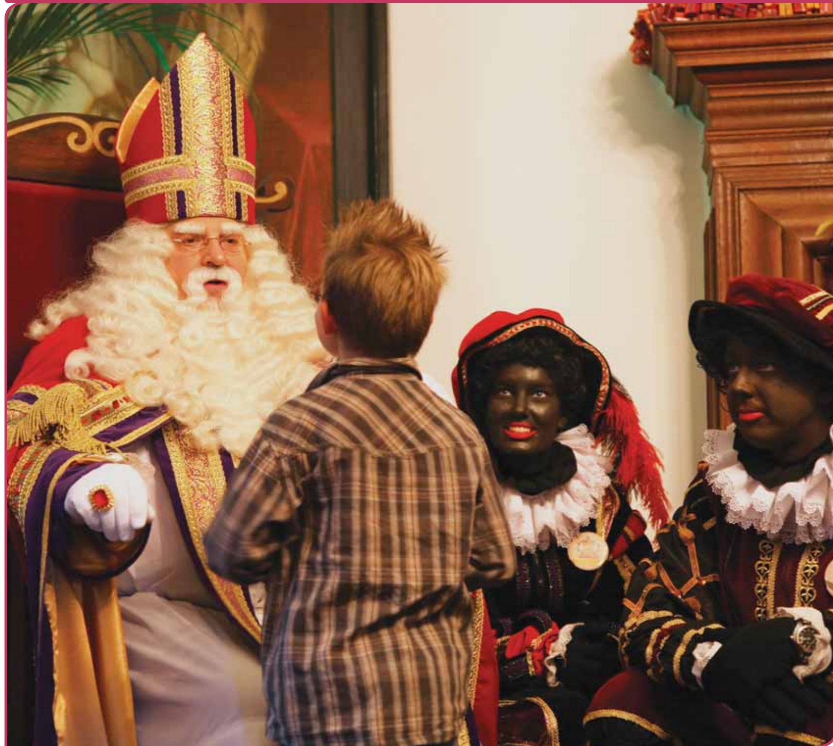
Sinterklaas is immaterieel erfgoed