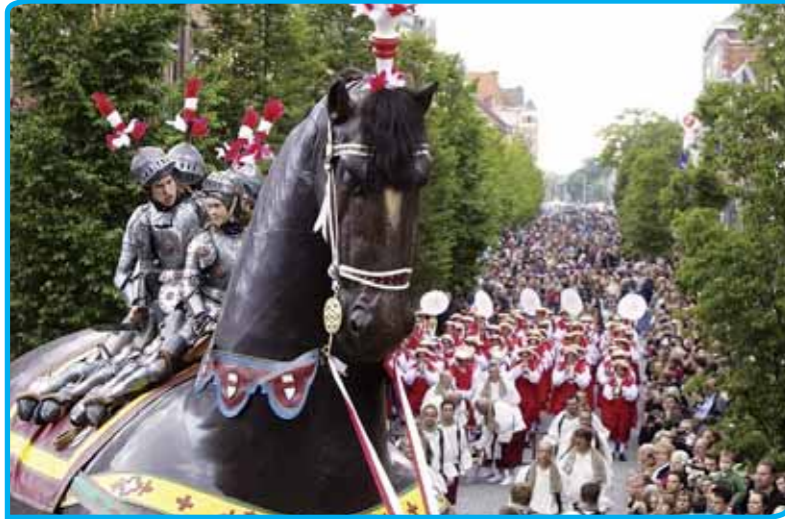
Ros Beiaardomvang in Dendermonde

Met al die zaken in het achterhoofd, komt men in Vlaanderen met de volgende definitie van immaterieel erfgoed. Immaterieel erfgoed is: