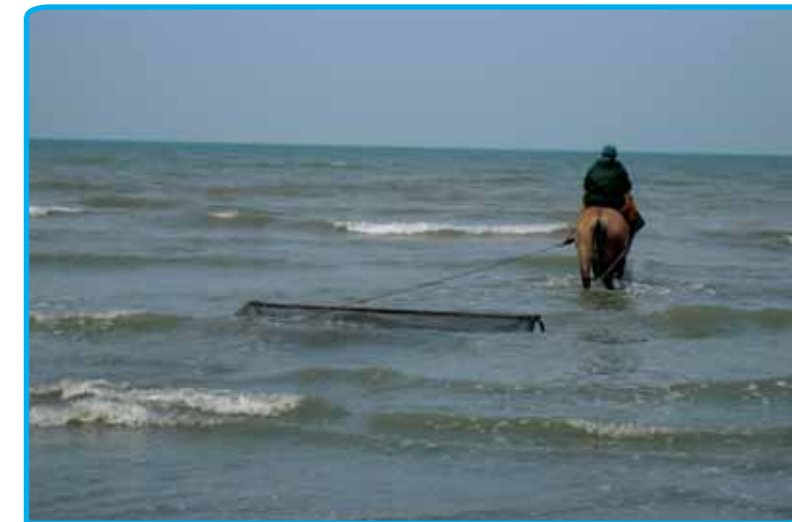
Garnalenvisserij in Oostduinkerke