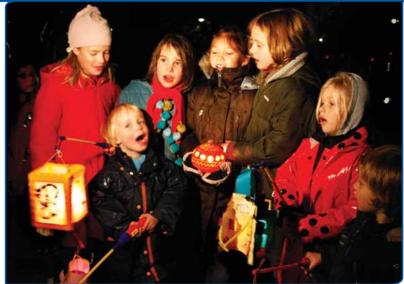
Sint Maarten in Utrecht

In de zaal wordt gevraagd of het Fonds ook kleine initiatieven zou kunnen ondersteunen. In de volkscultuursector is daar namelijk veel behoefte aan. Knol zegt dat het punt zijn aandacht heeft. In overleg met de provinciale volkscultuurconsulenten wil hij de toegankelijkheid van zijn Fonds proberen te verbeteren.