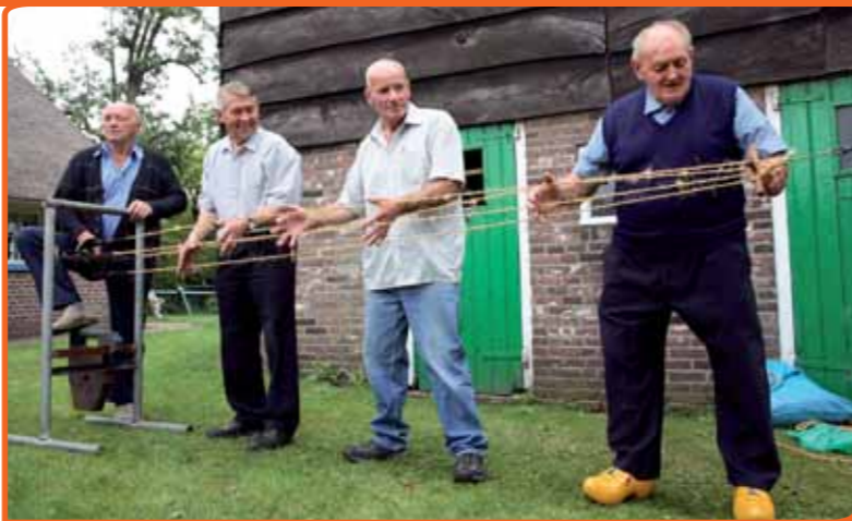
Touwslaan is een oud ambacht dat door vrijwilligers in herinnering wordt gehouden.

Hier speelt het doorgeven van kennis van generatie naar generatie een grote rol.