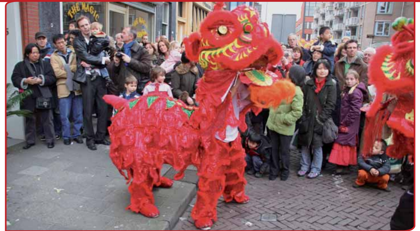
Den Haag is een multiculturele stad waarin de volkscultuur vanuit verschillende culturele roots wordt beleefd, zoals jaarlijks het Chinees Nieuwjaar.

De les van dit alles is dat beleidsmakers moeten uitkijken om niet onbewust allerlei drempels op te werpen, die het moeilijk maken om vanuit de basis goede volkscultuurprojecten in te dienen. Zoals het stellen van een kwaliteitseis, die slechts alleen in artistieke zin wordt ingevuld.