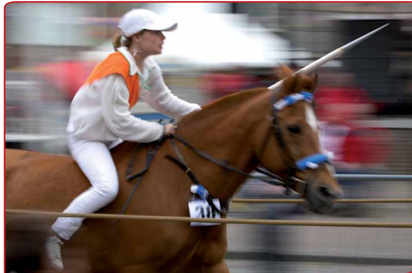
In Zeeland heeft men er voor gekozen om de levende volkscultuur te promoten.

In Gelderland zijn ze begonnen met het organiseren van een drietal expertmeetings onder de 800 culturele instellingen in de regio. In Gelderland vinden ze het heel belangrijk dat alles van onderop georganiseerd wordt: men kiest dus voor een bottom-up benadering om te zien waar behoefte aan is en welke verwachtingen er zijn. Ook wil men in Gelderland de vorming van nieuwe clusters en