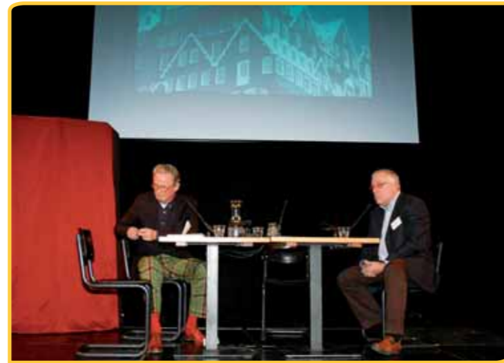
Lokale overheid en commercie was het thema van het tweede debat.