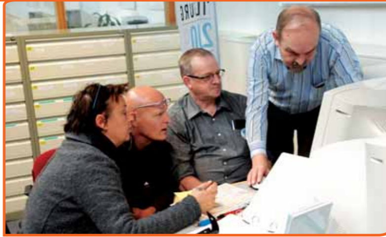
Een goed volkscultuurproject is altijd gebaseerd op kennis.

tradities beleef je samen. Door tradities voel je je met elkaar verbonden. Daar zit meteen ook een valkuil in: als je het hebt over 'wij', dan kan dat ook uitsluiten. Wij zijn daar altijd heel alert op. Daarom focussen wij ons op het delen van tradities en kennis hierover. Als je begrijpt waarom je dingen denkt en doet vanuit traditie – en als je de achtergrondverhalen kent – en je deelt dat met anderen, dan ontstaat er begrip en kweek je respect. Dan begrijp je ook waarom de een zus doet en de andere zo. Kennis delen is daarom voor ons een belangrijk uitgangspunt bij volkscultuurprojecten.