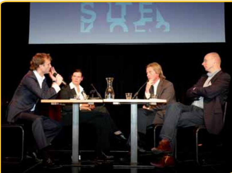
Het eerste debat was gewijd aan hoge en lage cultuur.

Het Zeeuws Museum daarentegen profileert zich als museum dat toont wat karakteristiek is voor de regio. Maar het museum wil dat doen op een spannende manier die niet-oudbollig is. Dat doet het museum door een link met het heden te leggen. Om het span-