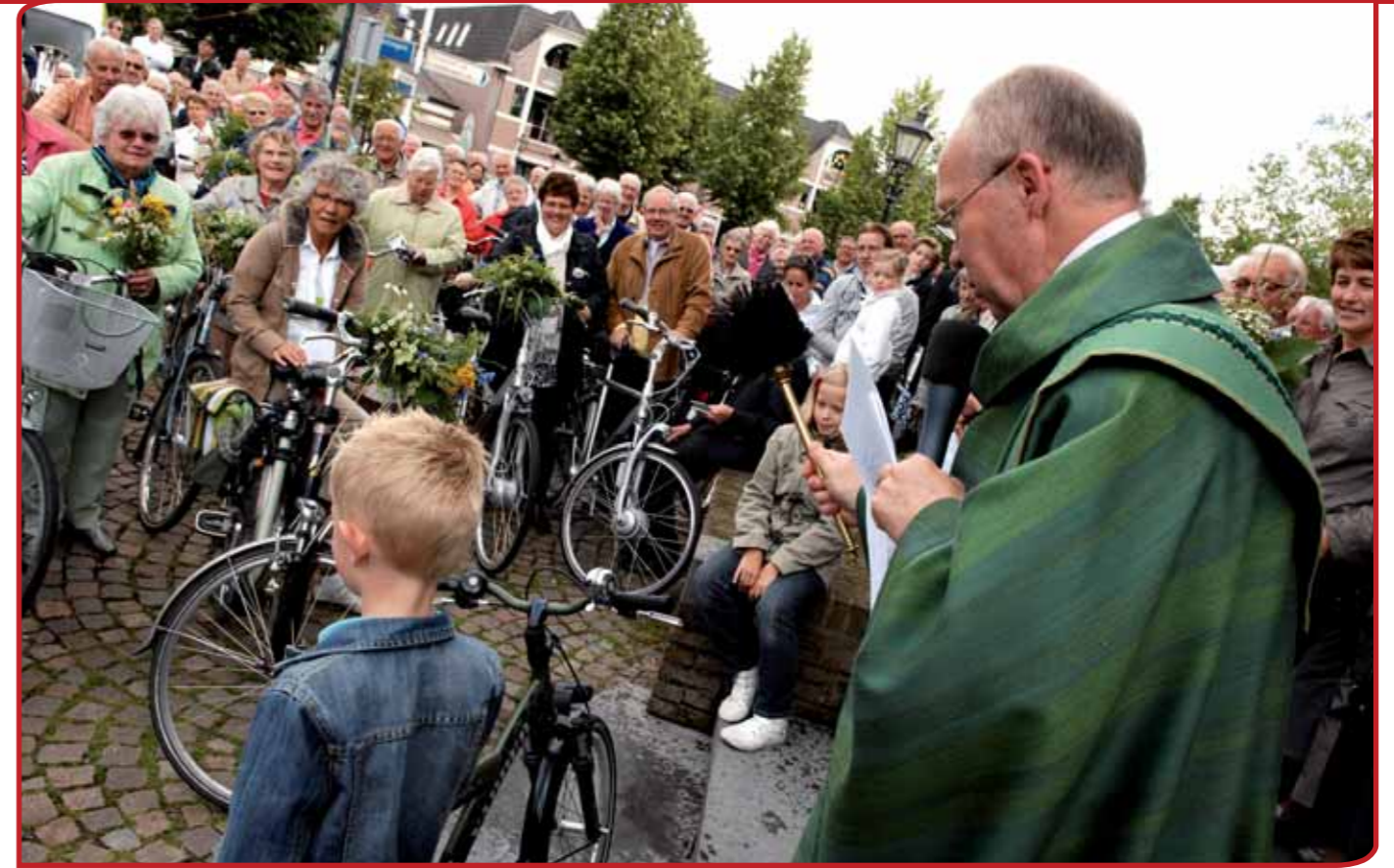
WieKentKunst organiseert elk jaar een weekend volkscultuur dat gedragen wordt door de inwoners van Moergestel. In 2009 werd het fietsen zegenen opnieuw ingevoerd.