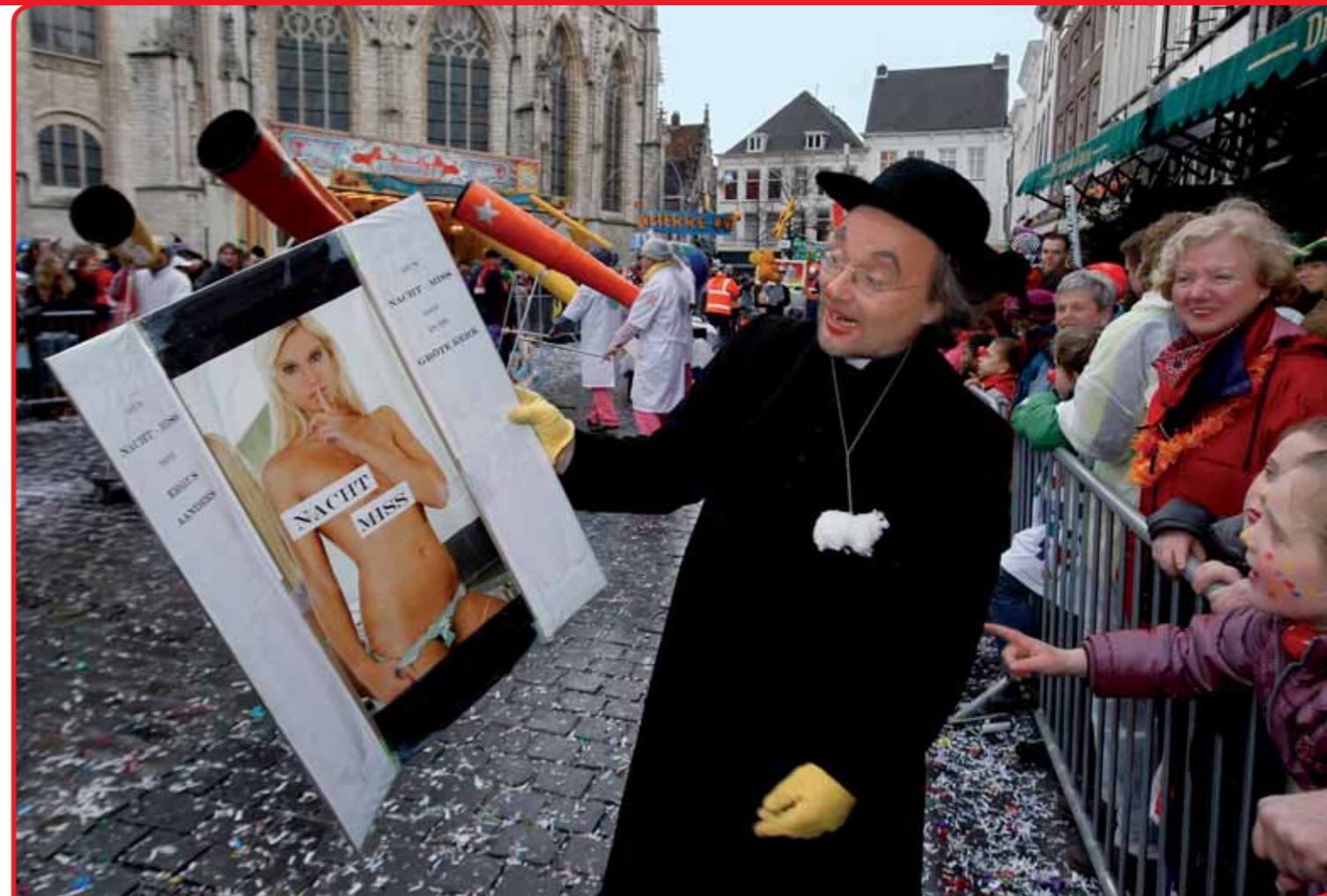
Carnaval werd in 2009 uitgeroepen tot de belangrijkste traditie in Noord-Brabant.

Aan de andere kant zetten overheden op landelijk, provinciaal en gemeentelijk niveau, als uitvloeisel van het nieuwe rijksbeleid, volkscultuur nu in als middel tot het vergroten van cultuur-