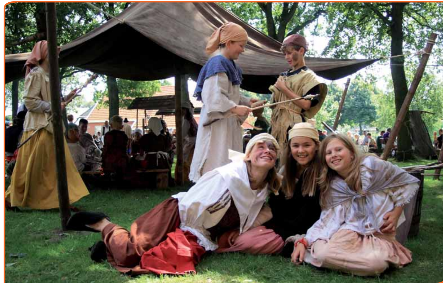
Op de Etsstoeldag in Anloo wordt een zeventiende-eeuwse rechtspraak nagespeeld.

Met de instelling van het Fonds voor Cultuurparticipatie wordt volkscultuur voor het eerst genoemd als belangrijk middel om cultuurparticipatie te bevorderen. Inmiddels hebben de provincies en grote gemeenten hun plannen ingediend, waarbij ze ook hebben moeten nadenken over wat ze met volkscultuur willen. Wij merken dat veel beleidsambtenaren het nog onwennig vinden om het nieuwe beleidsveld volkscultuur vorm te geven. Wij hebben veel vragen gehad over: 'Wat is volkscultuur?' en 'Hoe kun je het inzetten om cultuurparticipatie te bevorderen?' 'Welke projecten moet wij ondersteunen?' Wij hebben ook veel opmerkingen gehad als: 'Wij kunnen toch niet alle carnavalsverenigingen of sinterklaasoptochten gaan subsidiëren?' en 'Wat is het verschil tussen amateurkunst en volkscultuur?' Omdat veel beleidsmedewerkers in de periode hiervoor actief waren in het Actieplan Cultuurbereik en vooral uit de hoek van de amateurkunst komen, bestaat de neiging om volkscultuur te zien als een afgeleide van amateurkunst en/of cultuureducatie.