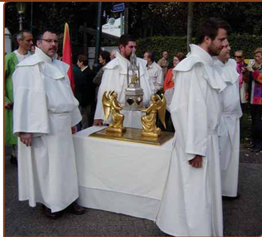
De bedevaart van Odrada werd nieuw leven ingeblazen.

Besloten werd om een speciale stichting onder de naam Stichting Cultuurhistorische Evenementen in het leven te roepen. Toen het besluit van de jaarmarkt eenmaal gevallen was, werd met een groep mensen het concept bedacht. Meteen werd de denktank verbreed naar andere organisaties en sleutelfiguren. Het was snel duidelijk: via levende geschiedenis moest het leven uit het einde van de Middeleeuwen worden nagespeeld. Draai-boeken werden gemaakt en aan organisaties die eerder met het bijltje gehakt hadden, werd om advies gevraagd.