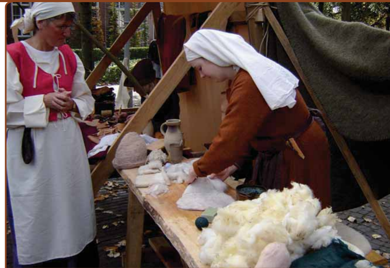
Levende geschiedenis bracht het hele dorp op de been.