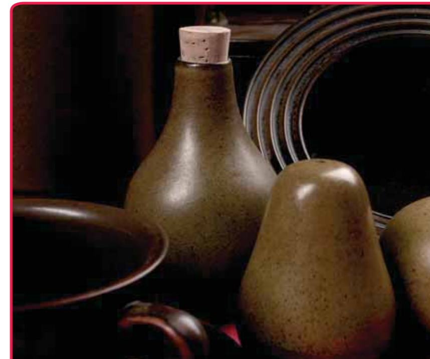
De tentoonstelling over huwelijksserviezen leverde heel veel ontroerende verhalen op.

de geboortetaart van zijn zoon, inmiddels de vijfde generatie, gepresenteerd op één van de taartplateaus.'