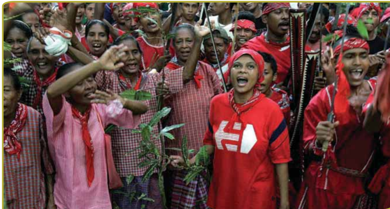
Panas pela is een Molukse traditie en betekent letterlijk het opwarmen van de pela ofwel het hernieuwen van een bondgenootschap

Vanwege de terugtrekking van de Nederlandse strijdkrachten werd het KNIL opgeheven. De militairen kregen de keuze terug naar huis te gaan óf zich aan te sluiten bij het Indonesische leger. De opstand op de Molukken zorgde voor complicaties bij de keuze. Aansluiting bij het Indonesische leger zou mogelijk betekenen dat je tegen je eigen volk zou moeten vechten en dus een broederstrijd zou moeten aangaan. Teruggaan naar de Molukken werd de mensen van het KNIL verboden door de Indonesische regering. Die wilde geen goed getrainde soldaten in een gebied waar een opstand tegen de staat zelf aan de gang was.