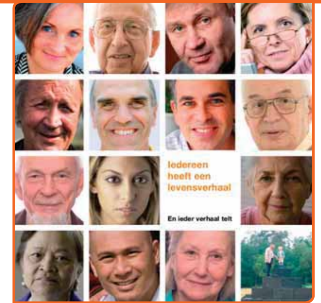
Door het verhaal van je leven op te schrijven, geef je een geschenk aan toekomstige generaties.

Fysiek wordt het geschreven materiaal beheerd op drie continenten, van elk verhaal worden drie exemplaren bewaard. Dan moet er wel een hele grote ramp gebeuren, wil dat verloren gaan. Het beheer gebeurt aan de hand van de technologie van dat moment. De techniek schrijdt voort en we zullen ons steeds bedienen van een ander middel. Qua beheer is dat een relatief eenvoudig probleem.'