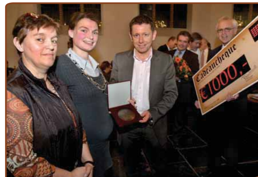
Kermis tussen Kerk en Kroeg werd genoemd door de jury.