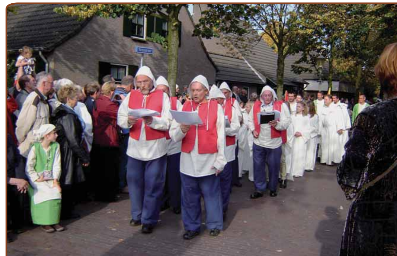
Er werd een gregoriaanse mis opgedragen en een processie gehouden.