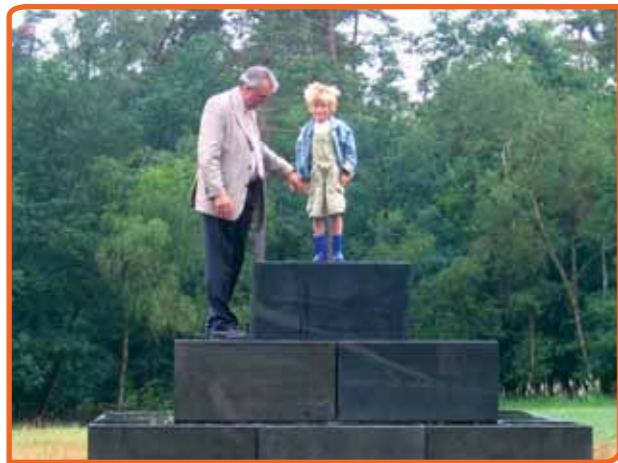
ENO is een overdracht van generatie op generatie.

'We zijn in 2000 begonnen met de voorbereidingen. Pas sinds twee jaar zijn we stapsgewijs bezig met het daadwerkelijk toelaten van mensen. Wat we niet hadden voorzien is dat wij er meer dan vijf jaar over gedaan hebben om de bouwvergunning voor het monument definitief voor elkaar te krijgen. De piramide moest op pleistoceenzand komen. Alleen die ondergrond zou het uiteindelijke gewicht kunnen dragen. TNO heeft voor ons een plek uitgezocht en dat bleek Apeldoorn te zijn. Op 21 juni is er daar jaarlijks een bijeenkomst voor de deelnemers. Soms nodigen we sprekers uit en in de toekomst denken we