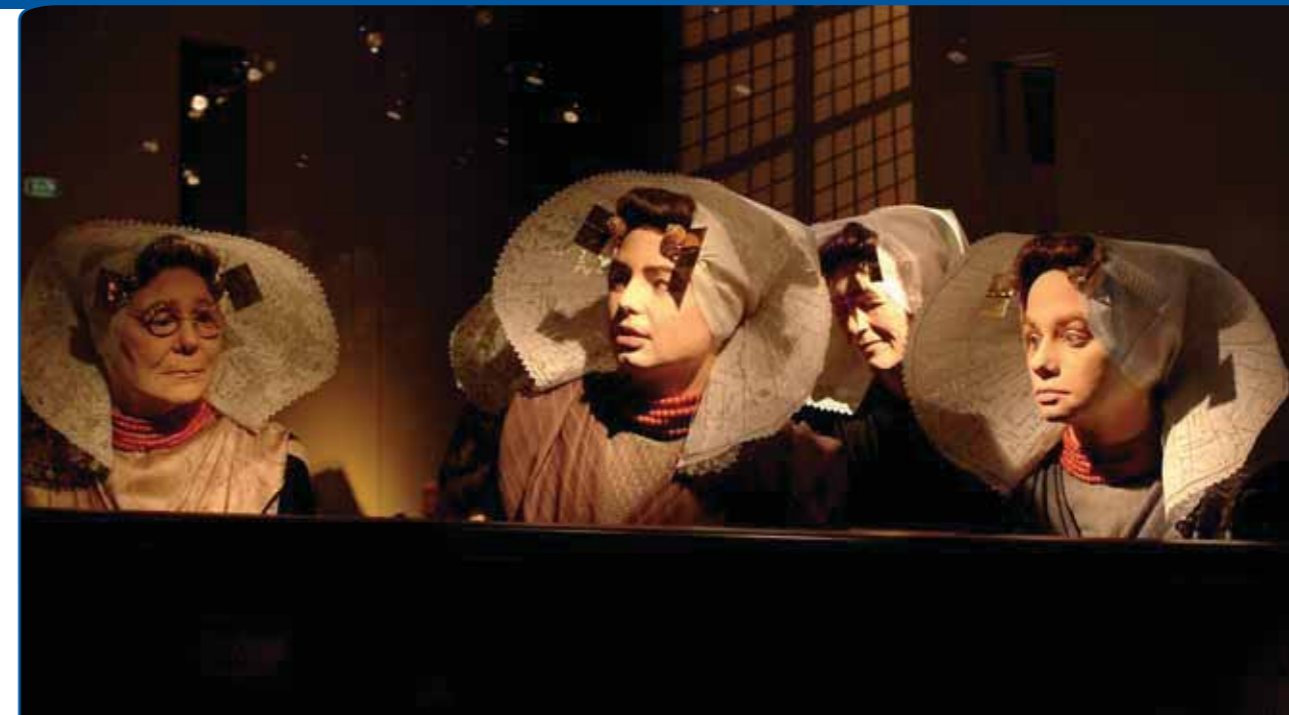
De collectie Koningin Wilhelmina is in permanent bruikleen van het Nederlands Openluchtmuseum.

van kennis daarover. Bij haar afscheid in 1991 kreeg zij het Ere-kruis van de Huisorde van Oranje, uitgereikt door de directeur van het Koninklijk Huisarchief.