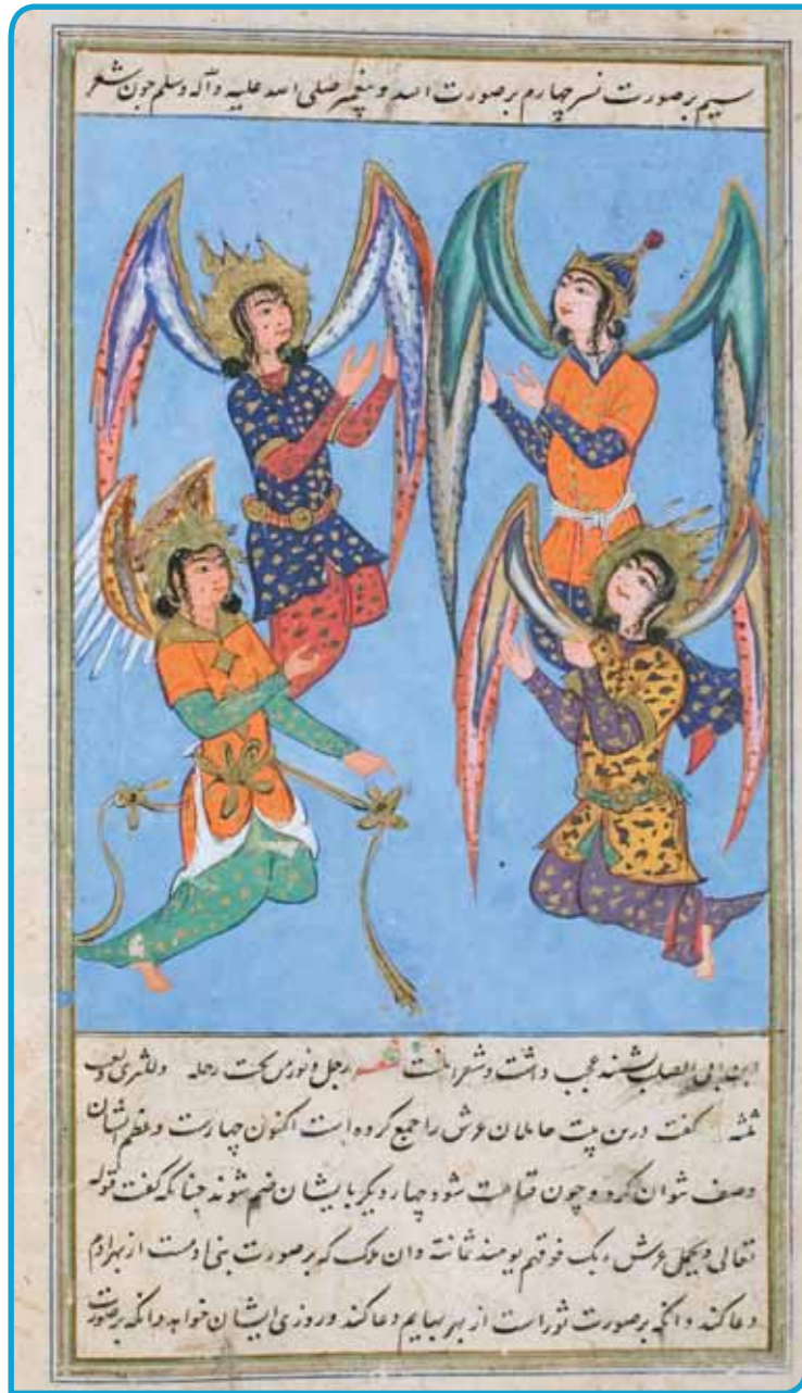
De vier engelen die Gods troon dragen Miniatuur in Zakariyya ibn Muhammad al-Qazwini (circa 1203-1283)