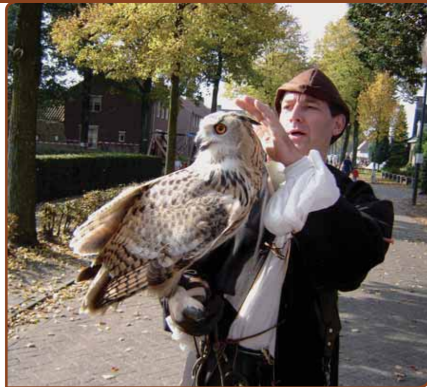
Tijdens de middeleeuwse jaarmarkt werden er ook demonstraties valkerij gehouden.

Mensen uit De Mierden zijn niet alleen praters, maar ook doeners. Alle vier de gilden veerden op toen op hen een beroep