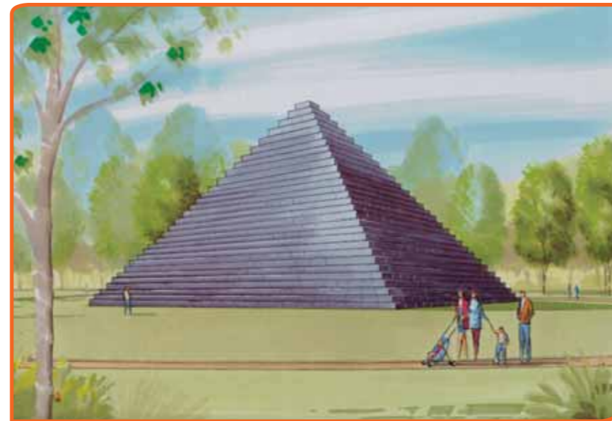
Het monument EON wordt gebouwd met blokken zware granieten steen.

Hoe wordt het materiaal echt heel lang bewaard?