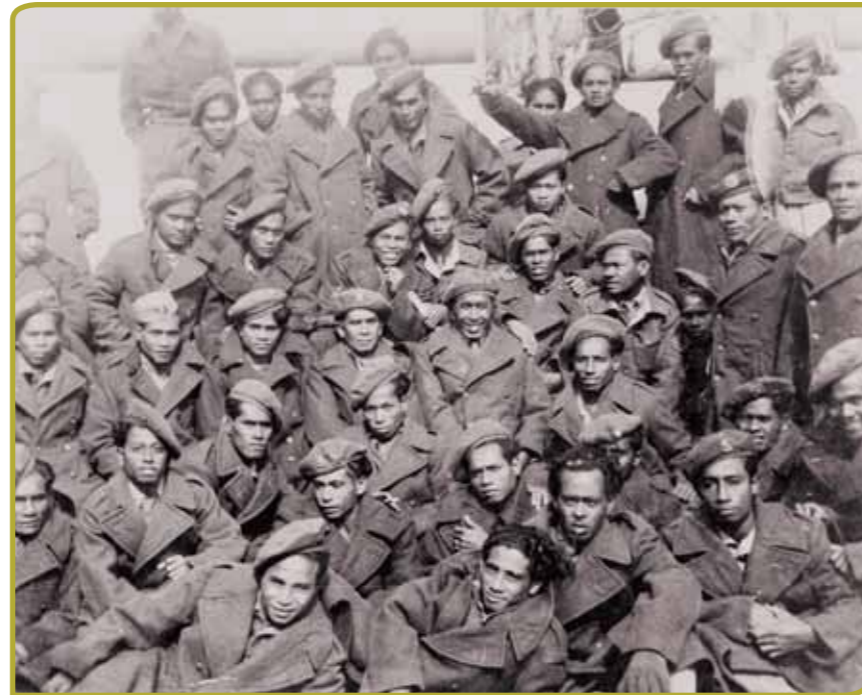
Groep militairen in winteruniform tijdens de reis naar Nederland (1951)

Eén van de pijlers is dat het individu vooral wordt gezien als een schakel in een groter geheel; van het gezin, de familie, de clan en het dorp. Bij een belangrijke gebeurtenis wordt iedereen