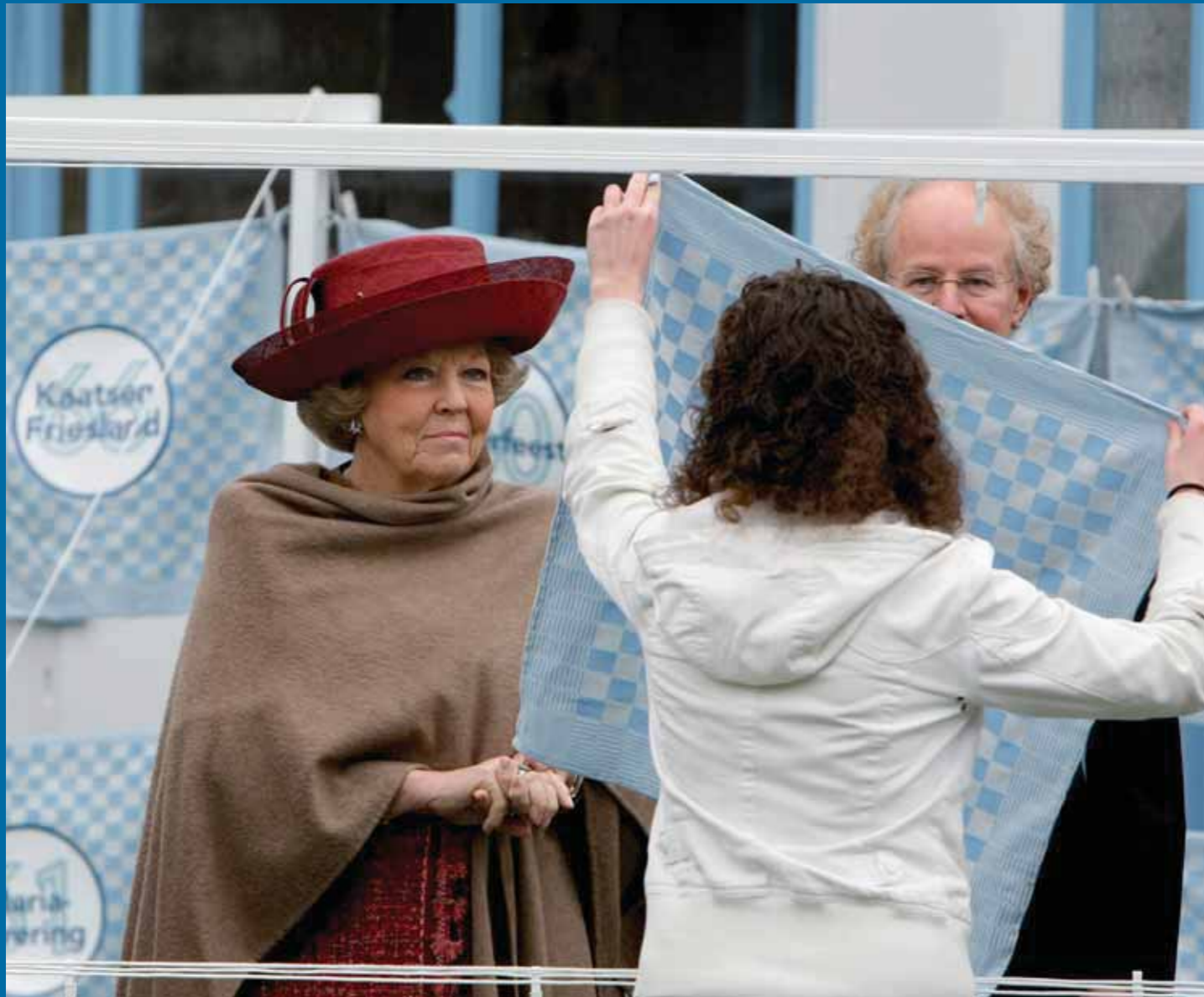
Koningin Beatrix krijgt de theedoek met het logo van het Jaar van de Tradities.

In het begin van de vorige eeuw was Volkskunde of Etnologie een wetenschap die probeerde de essentiële eigenschappen van een volk te vinden door de bestudering van de cultuur van boeren en vissers. In deze relatief ongerepte cultuur zouden oeroude volksgebruiken hebben kunnen overleven. Door