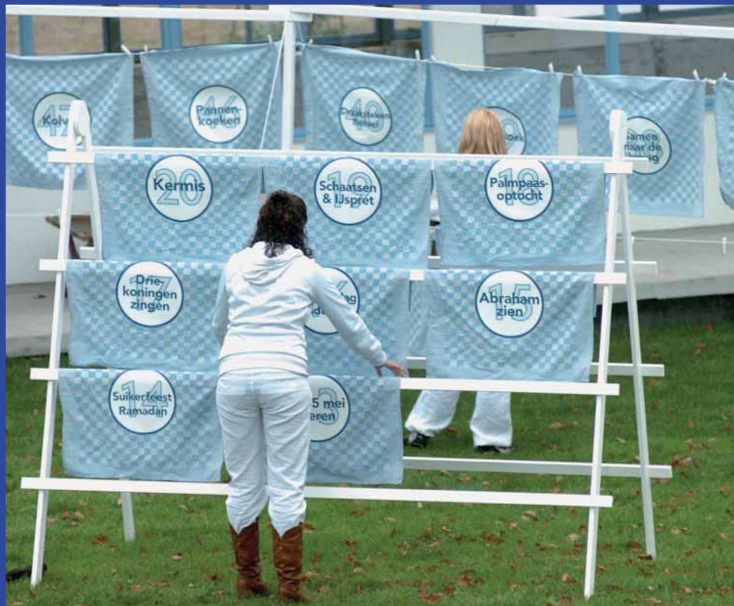
Theater in de wijk Stut hangt de 100 theedoeken met tradities op.

tiek te ontmaskeren. Omgekeerd ervoeren veel mensen wier tradities als nieuwe tradities werden aangemerkt, dat als een veroordeling, een afkeuring.