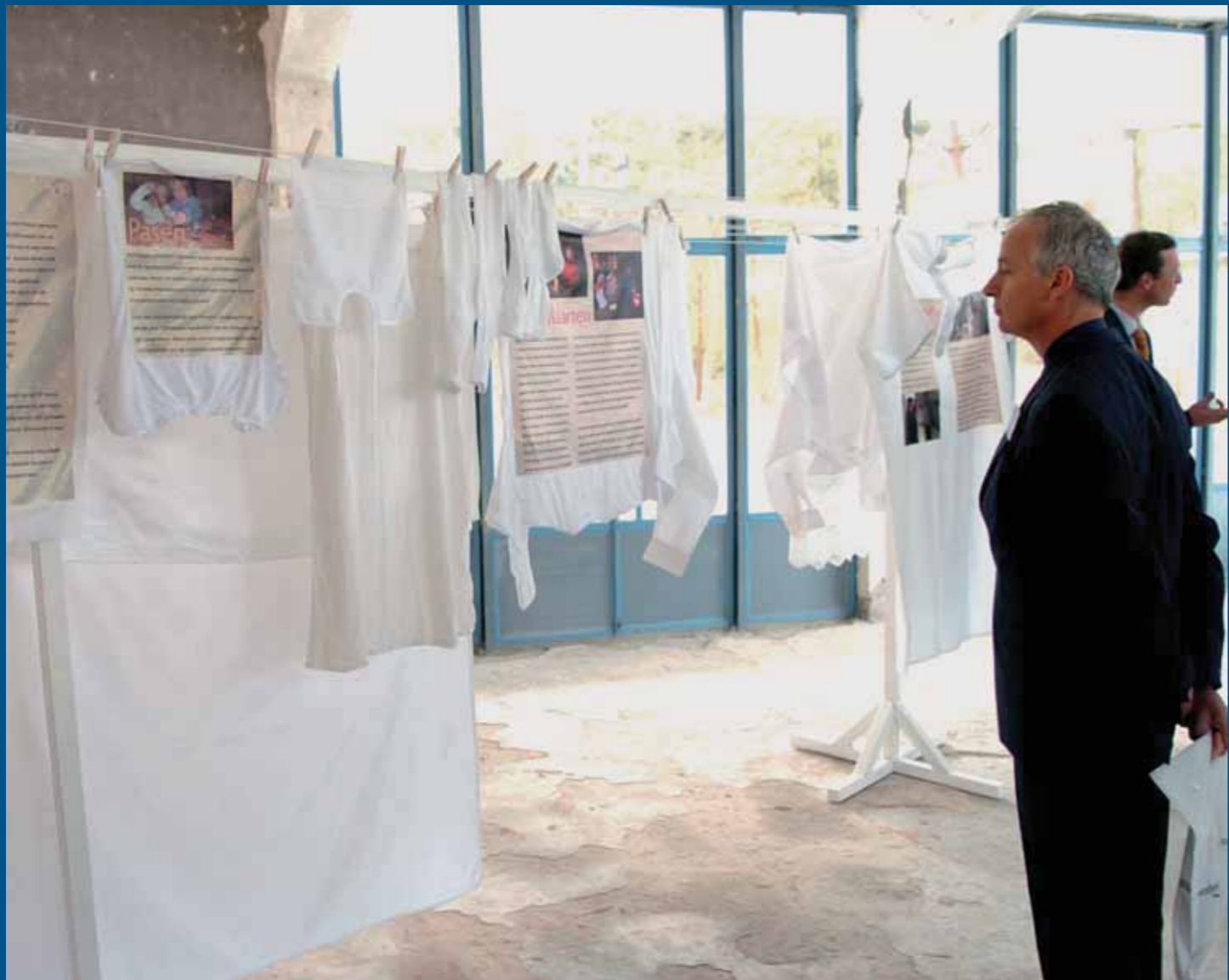
De bijzondere expositie over de achtergronden van de bekendste tradities in Nederland is op wasgoed gedrukt, om zo binnen en buiten tentoongesteld te kunnen worden.

kijken. Welke feesten worden er gevierd in een woonplaats? Welke culturen wonen er in mijn omgeving? In de gemeentegids en in de lokale krant is dikwijls al veel informatie te vinden. Ook kun je op zoek gaan naar mensen die veel contacten hebben: een vroedvrouw, dokter, politieagent, geestelijk leider of kroegbaas bijvoorbeeld. Gesprekken met mensen kunnen veel informatie opleveren. Stel steeds de vraag: 'Wat zijn voor mij en voor u waardevolle tradities en rituelen en waarom?' Belangrijk is om medestanders te zoeken.