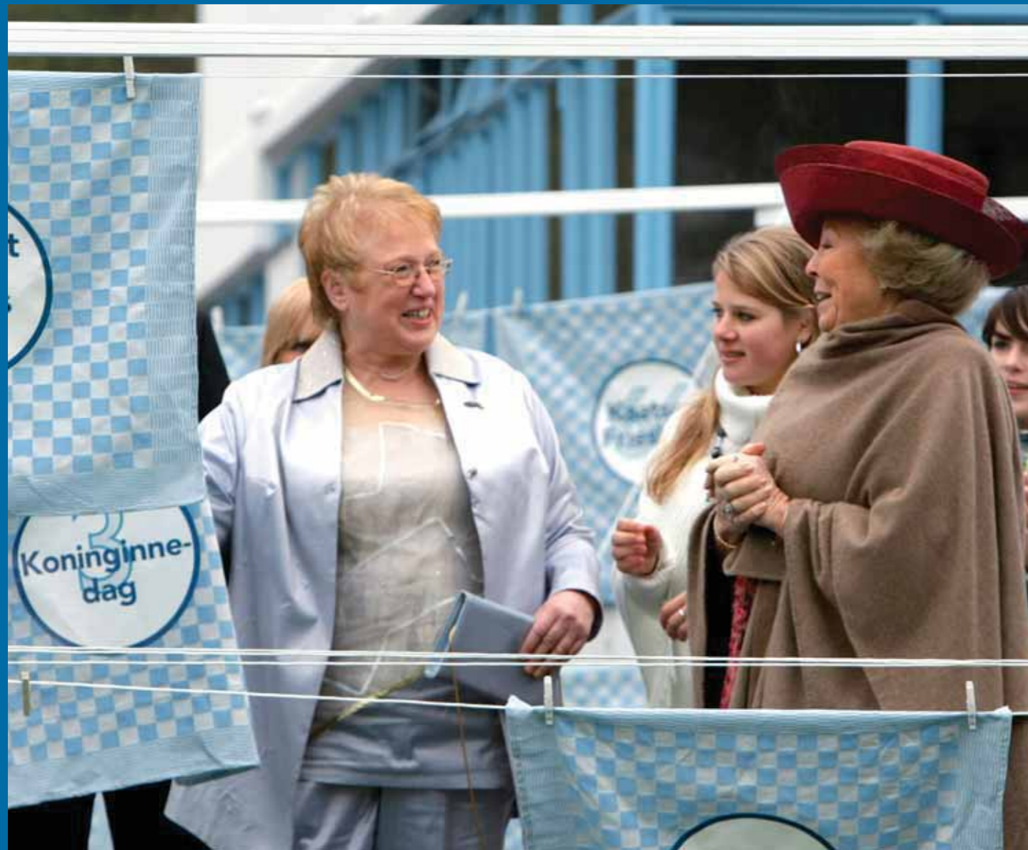
Koninginnedag staat op nummer 3.

bestudering van het dagelijkse leven van deze groepen zouden wij zicht krijgen op de ware identiteit van ons volk. Deze romantische en nationalistische visie is reeds lang verlaten door de wetenschap. Er zijn overigens partijen in onze samenleving die nog steeds menen dat onze identiteit ligt in een eeuwenoude cultuur die bewaard gebleven is in de tradities van het gewone volk. De recente publieke discussie over de identiteit van de echte Nederlander laat dit overduidelijk zien.