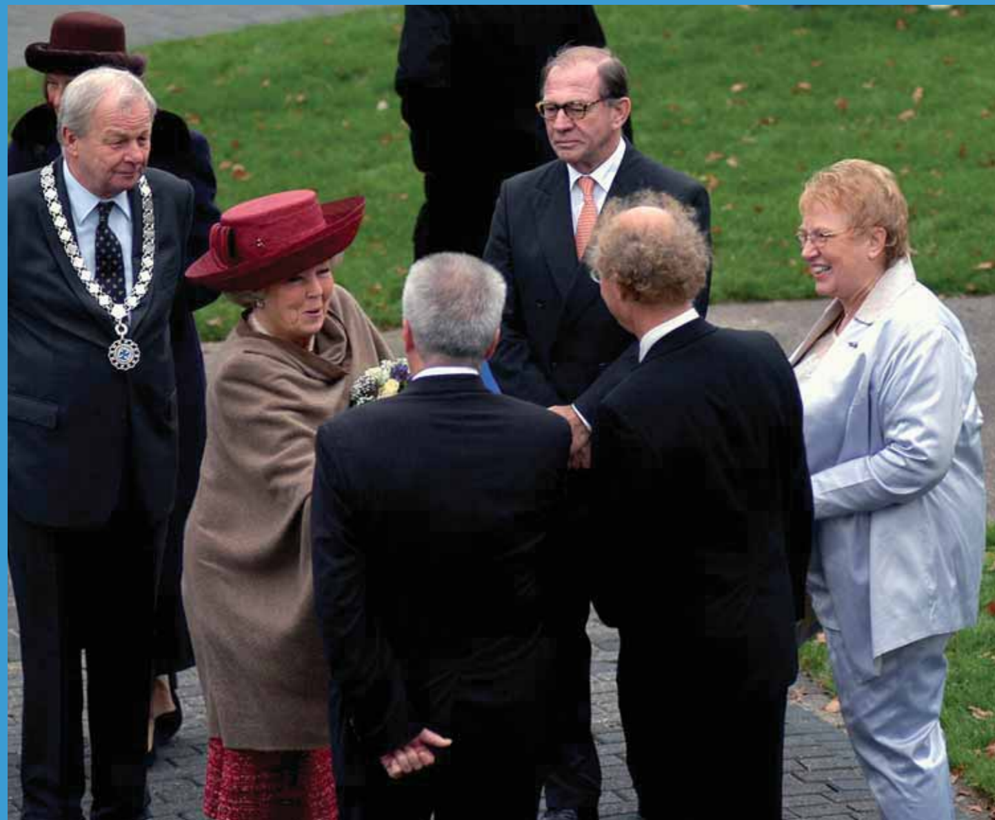
Koningin Beatrix begroet de directeur en de voorzitter van het Nederlands Centrum voor Volkscultuur en de voorzitter van Zonnestraal.