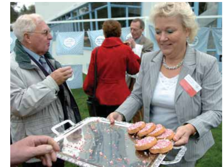
Bij de geboorte van het Jaar van de Tradities hoort kandeel en beschuit met muisjes.

Al enige tijd woedt er een strijd tussen Sinterklaas en de Kerstman, waarbij de Kerstman kan rekenen op veel vrienden in het bedrijfsleven. Voorlopig heeft de goede Sint de aanvallen van Santa Claus weten af te slaan. Maar hoe lang houdt hij nog stand? Bovendien kunnen we vaststellen dat Sinterklaas in de loop der tijd nogal wat veranderingen heeft doorgemaakt. Denk maar eens aan de roe,