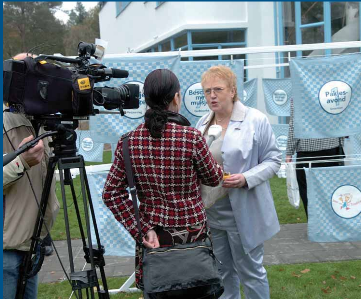
De opening trok pers uit binnen- en buitenland.