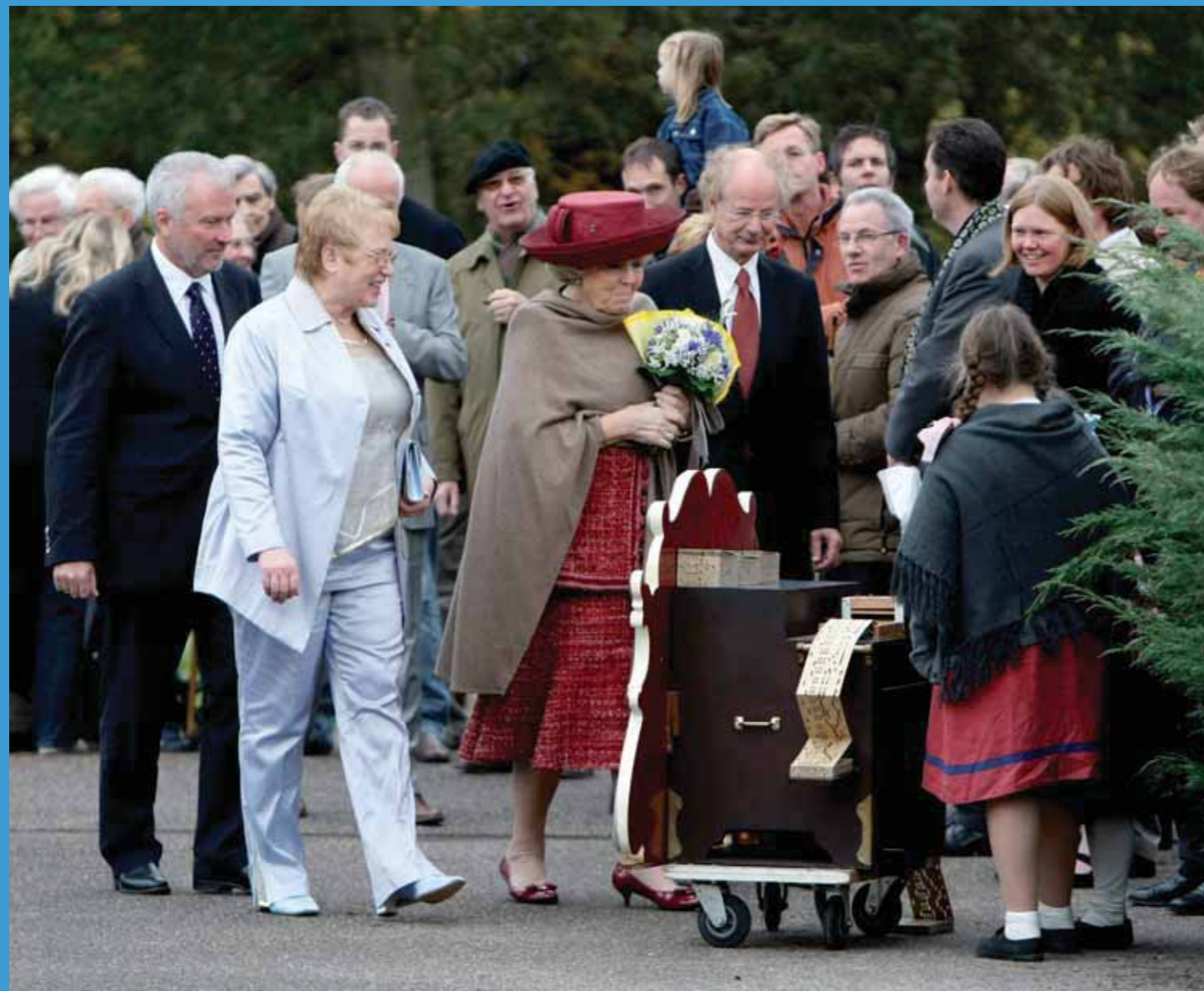
De directeur van Museum van Speelklok tot Pierement had een draaiorgeltje meegenomen.

blauwe kousenband. Echter sinds twintig jaar is de kousenband weer helemaal ín. Heel veel bruiden dragen hem weer. Hij hoort bij de moderne bruidsjurk. Vaak doet de bruid hem op het einde van het feest af en gooit hem net als het bruidsboeket over de schouder naar de gasten.