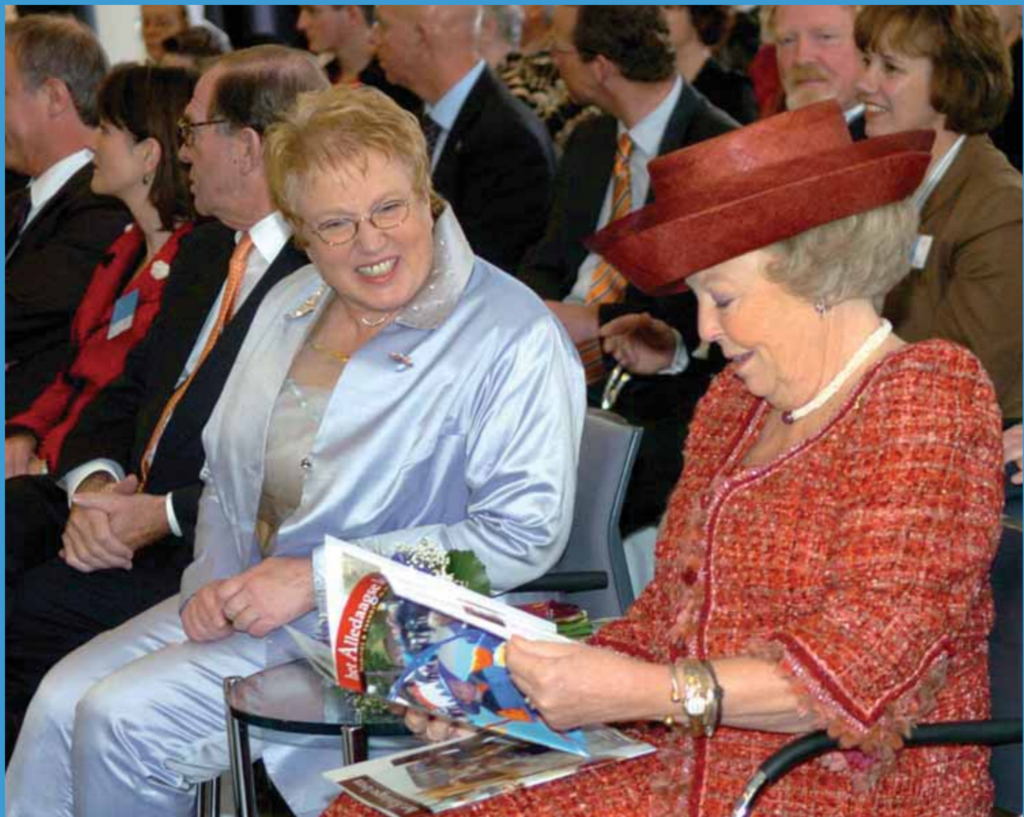
Koningin Beatrix ontving uit handen van Wim Waanders de twee eerste exemplaren van de nieuwe boekenreeks het Alledaagse leven , één van de rode draden van het Jaar van de Tradities.