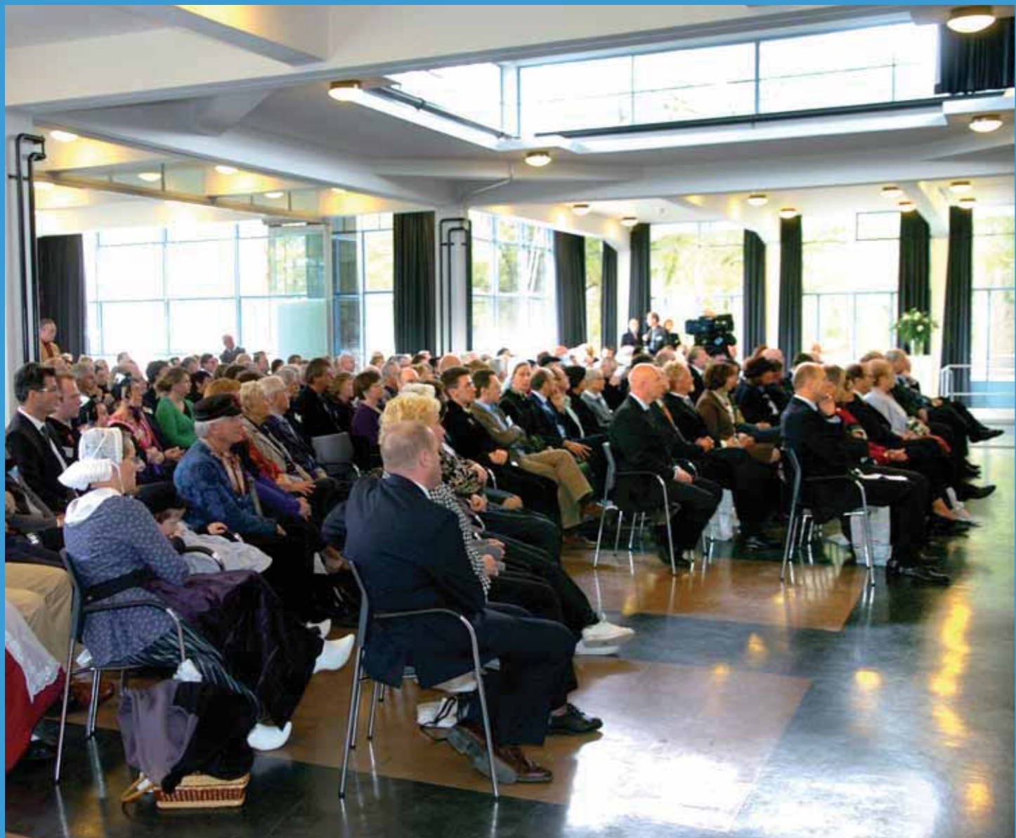
Afgevaardigden van landelijke en regionale volkscultuurorganisaties waren naar Hilversum gekomen om de opening bij te wonen.

vrienden of club – pas je je aan en hanteer je de tradities die in die groep gangbaar zijn. Tradities maken dat je je samen verbonden voelt.