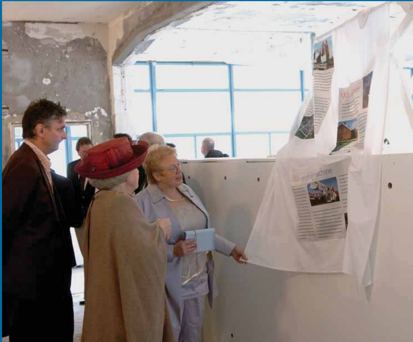
In het Dresselhuys was de tentoonstelling De was buiten, over tradities in Nederland te zien.

graancirkels; nieuwe begrafenisrituelen sinds de dood van prinses Diana, Pim Fortuyn en André Hazes zijn interessante verschijnselen, net als de huidige rage van stille optochten en monumenten langs de kant van de weg.