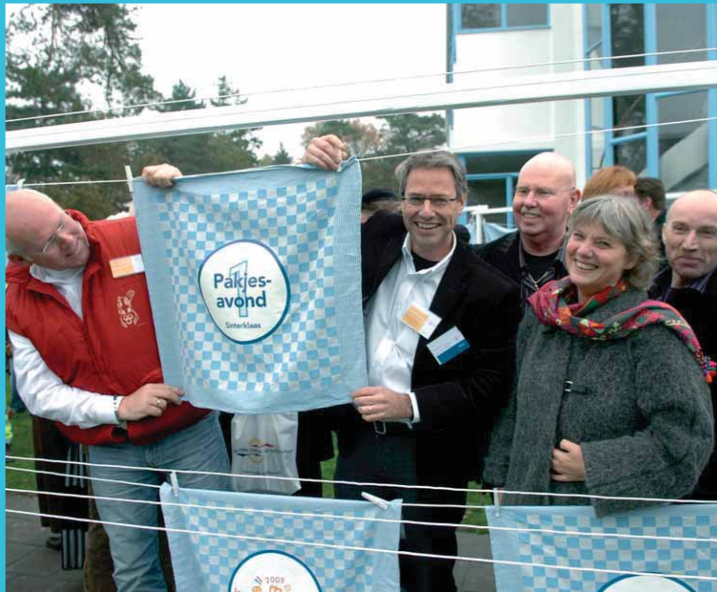
Het Sint Nicolaas Genootschap was blij met de eerste plaats voor Sinterklaas.

Tradities en immaterieel erfgoed zijn het cement van een veranderende samenleving en spelen een belangrijke rol in de cultuur van het dagelijks leven. Maar wat vinden mensen die lang of kort in Nederland wonen nu echt belangrijke tradities? Het Nederlands Centrum voor Volkscultuur daagde iedereen uit om na te denken over zijn eigen alledaagse en bijzondere tradities en rituelen. Duizenden mensen stuurden hun top tien op.