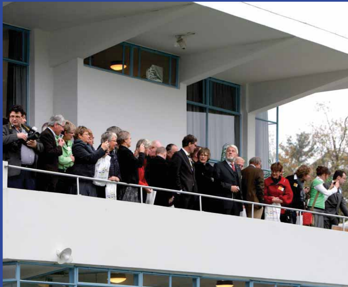
Vanaf het balkon hadden de gasten goed zicht op de opening.