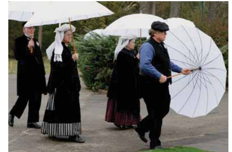
Tijdens de opening was het droog, maar voor de zekerheid had het Nederlands Centrum voor Volkscultuur voor paraplu's gezorgd.

Maar is het niet juist deze dynamiek die onze Sinterklaas in leven houdt? Is het erg als Sinterklaas met een Turks accent zou spreken en omringd wordt door witte pieten? Als wij de traditie willen normeren, dan wordt het een museale traditie, een ritueel dat een plaats krijgt bij braderieën en georganiseerde evenementen. Dan bestaat het risico dat Sinterklaas op termijn niet langer de springlevende, dynamische oude man van nu is, die bereid is om zijn gedrag aan te passen aan een veranderende wereld. Dan zal de brave man verkommeren in het museum van oude gebruiken. Het is daarom vanuit een etnologisch perspectief cruciaal dat wij in het kader van de UNESCO streven naar een dynamische vorm van bescherming, waarin met respect wordt omgegaan met het verleden, maar waarin voldoende ruimte is voor verandering en dus voor de toekomst. Kernbegrippen daarbij zijn documenteren en faciliteren.