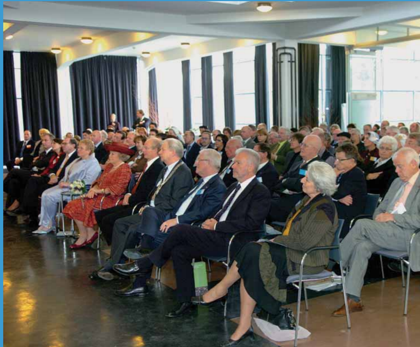
Aandachtig gehoor voor de lezingen

De enquête laat zien dat wij in een boeiende tijd leven. Aan de ene kant werden er nog veel oude christelijke tradities genoemd – soms zelfs tradities waar wij de achtergronden niet precies meer van weten (zoals Hemelvaart en Pinksteren) –, aan de andere kant hebben mensen ook veel nieuwe tradities geselecteerd (elke dag je e-mails lezen bijvoorbeeld of elk jaar naar de gayparade gaan). Ook de tradities van mensen die nog niet generaties lang in Nederland wonen, zijn verrassend vaak genoemd (enkele zijn het Suikerfeest, Divali en broodje Pom).