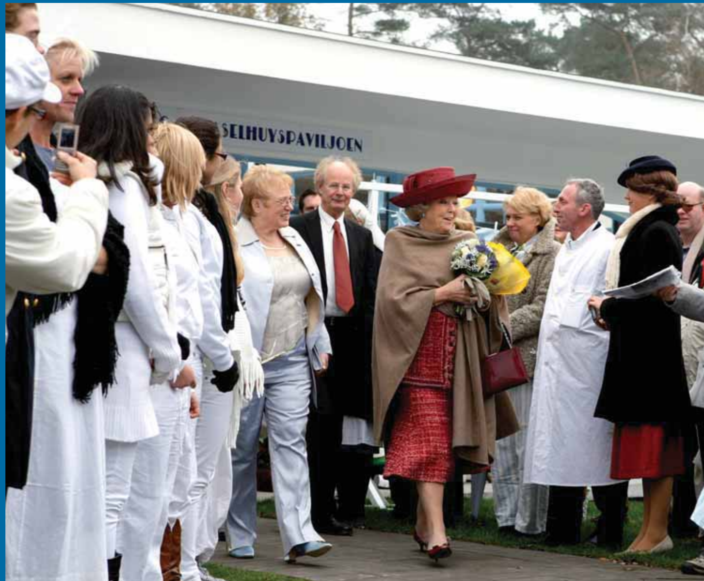
Uitgezwaaid door de levende geschiedenis groepen neemt Koningin Beatrix afscheid.

die in mijn jeugd nog prominent aanwezig was, maar inmiddels zijn dreigende werking verloren heeft; waarschijnlijk vanwege een veranderde visie op de opvoeding van kinderen. Een UNESCO-status zou Sinterklaas mogelijk beschermen tegen verdere aantasting en verloedering. Het is immers niet ondenkbaar dat de zwartgeverfde pieten met hun rare taaltje politiek incorrect bevonden worden of dat Nederlanders van Turkse afkomst bezwaar maken tegen het feit dat de Turkse bisschop elk jaar maar weer uit Spanje komt. In de huidige multi-culturele discussie is de status van Sinterklaas verre van zeker.