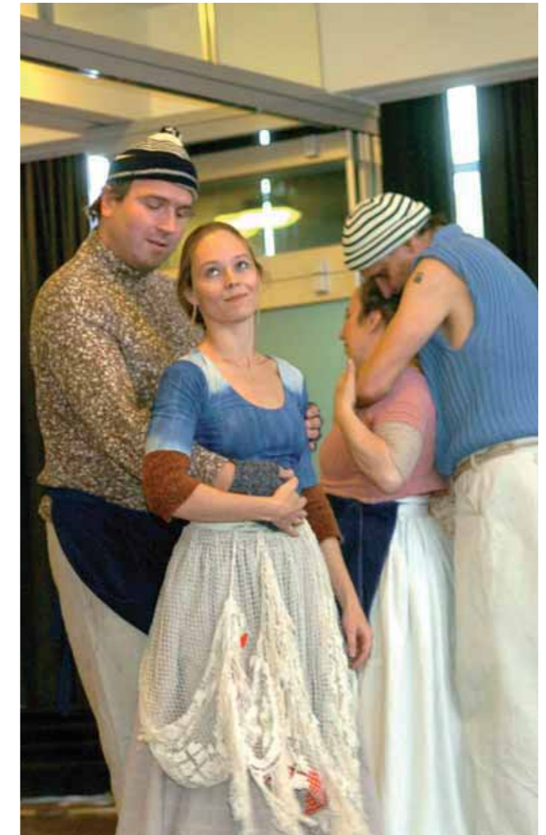
Volksdanskunstgroep Piet Hein

Op het einde van het Jaar van de Tradities zullen wij daardoor beter zicht hebben op welke tradities en rituelen in de Nederlandse samenleving een plek hebben en wat hun context en betekenis is. Met in ons achterhoofd dat tradities dynamisch zijn en dat mensen er over dertig jaar anders over zullen denken.