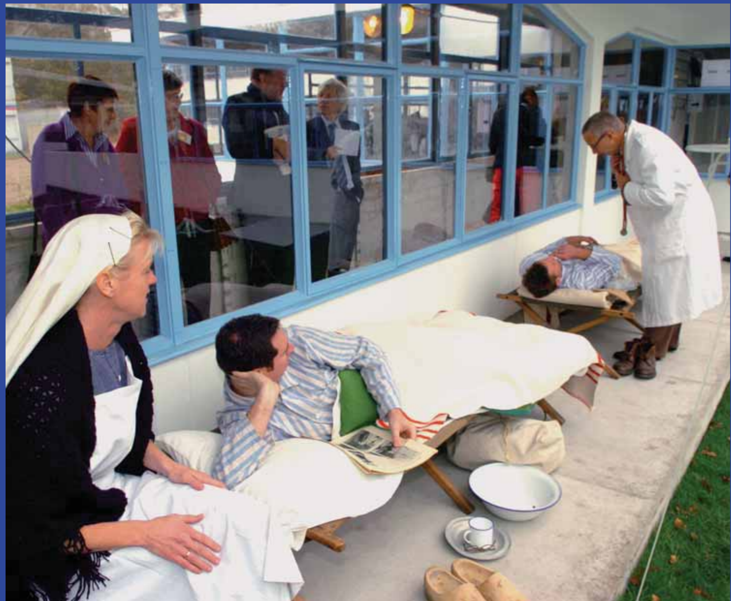
Re-anactors van het Festival Gezondheid

sen echt samenbinden, zijn namelijk nooit vanzelfsprekend. Ze vragen om voortdurende toe-eigening en betekenisgeving: want als mensen zich tradities niet eigen maken en niet een voor hen betekenisvolle lading geven, verworpen ze tot loze gebaren. Zodra mensen hun betekenis niet meer kennen, of beter gezegd, er geen betekenis meer in kunnen leggen, zijn ze ten dode opgeschreven en verliezen ze hun bindende kracht.