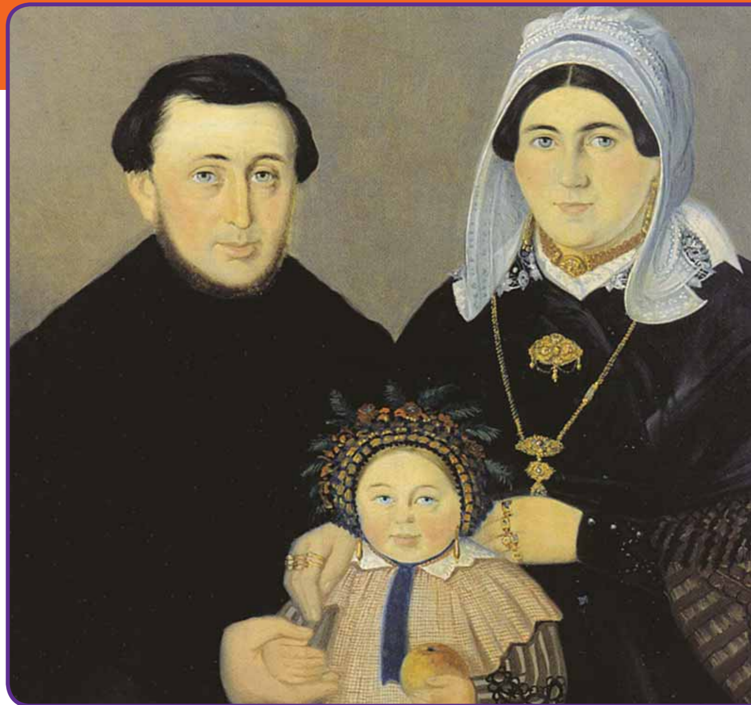
Portret van de familie Schillemans-Morres. Moeder en dochter dragen veel sierraden. Schilderij van J. Haak (1867) Particuliere collectie