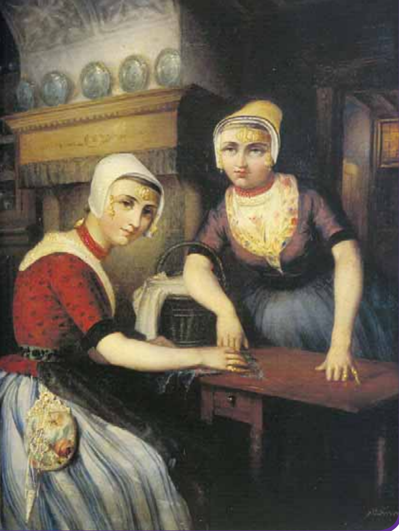
Twee Walcherse meisjes Schilderij van J.C. Frederiks Collectie: Nederlands Openluchtmuseum

Het resultaat: een lijvig boek op groot formaat, indrukwekkend in zijn opzet en inhoud en bovendien fraai om te zien. De makers hebben het tijdvak 1800-2000 opgedeeld in blokken van vijftwintig jaar (ongeveer één generatie). Ieder hoofdstuk komt overeen met zo'n blok. Steeds vraagt men zich af hoe de Zeeuwse samenleving eruit zag; hoe de burgermode was; welke ontwikkelingen er in de streekdrachten waren en hoe de drachten er feitelijk uit zagen. Die terugkerende thema's komen de leesbaarheid van