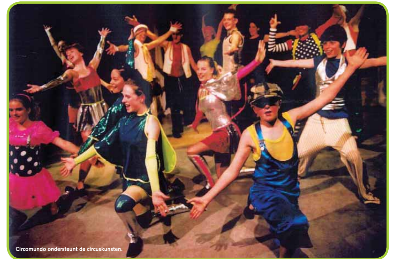
Circomundo ondersteunt de circuskunsten.

In 2003 deed Circomundo, met onder andere ondersteuning van Theaterwerk NL en het FAPK, een onderzoek naar de stand van zaken in het jeugdcircus in Nederland. Dit onderzoek – Het circus