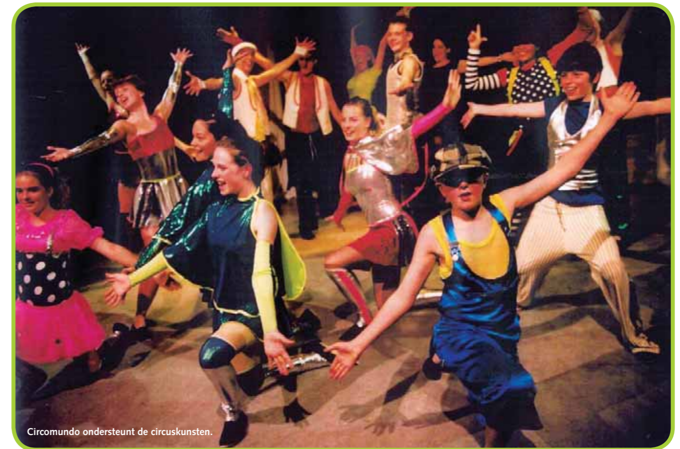
Circomundo ondersteunt de circuskunsten.

In 2003 deed Circomundo, met onder andere ondersteuning van Theaterwerk NL en het FAPK, een onderzoek naar de stand van zaken in het jeugdcircus in Nederland. Dit onderzoek – Het circus