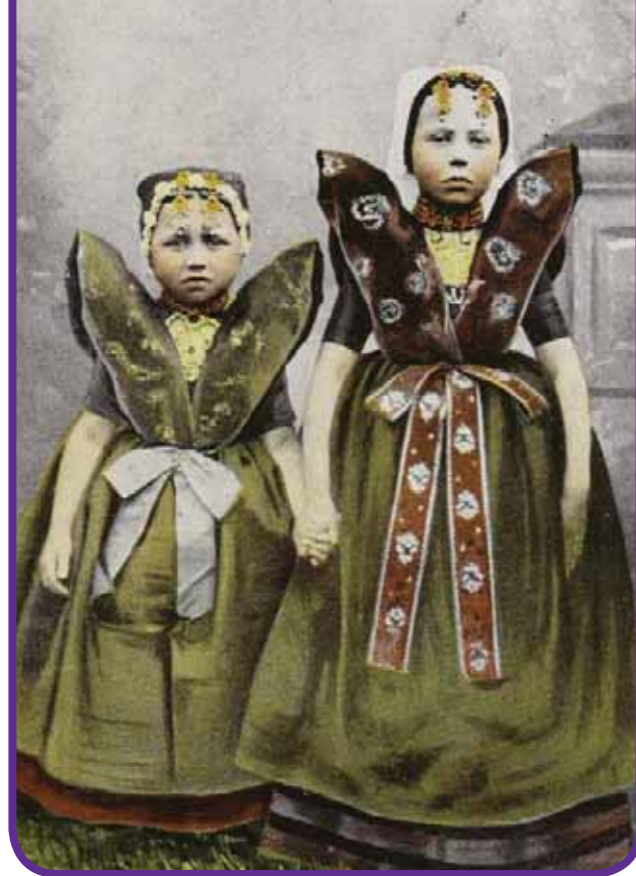
Meisjes in de streekdracht van Axel.

van beide. Vrouwen waren daarbij wel eens rijkelijk voorzien van zilveren of gouden hang-en-sluitwerk, zoals één van de foto's van het boek laat zien. De geportretteerde dame draagt behalve een gouden oorijzer met mutsenbellen (die aan weerszijden van het voorhoofd worden gedragen), diverse borstzeugen (gouden broches), een vuistgroot voorslot aan haar bloedkorallen ketting en