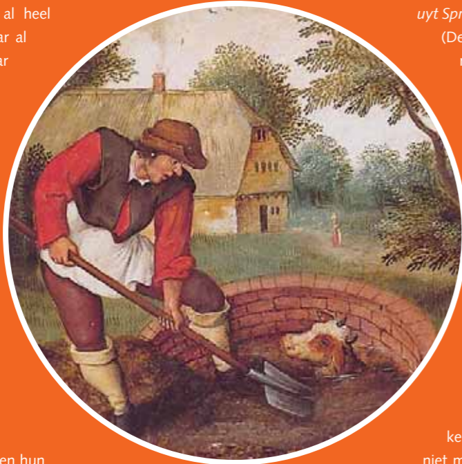
Pieter Breughel de Jonge (1569-1638) Als het kalf verdrinkt is, dempt men de put , 1599 Olieverf op paneel, 29,9 x 29,6 x 5,4 cm Koninklijk Museum voor Schone Kunsten, Antwerpen

De tentoonstelling 'Spreeken is zilver, kijken is goud' is tot en met 3 september 2006 te zien in het Noordbrabants Museum, Verwersstraat 41, 's Hertogenbosch ( www.noordbrabantsmuseum.nl ). ■